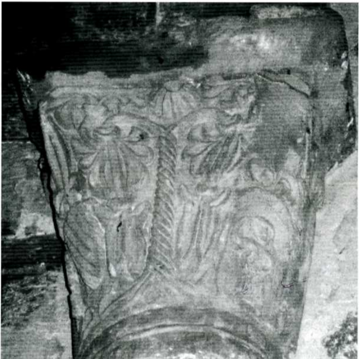
Eglise de Saint-Pierre-des-Champs à Chabریان Arbre de vie du XII e s.