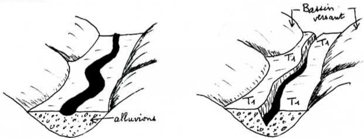
a) Le cours d'eau serpente dans son lit et dépose des alluvions sur une grande largeur.

Les galets des terrasses sont souvent striés (au cours de leur transport dans la glace) ou cassés. Certains éléments d'une terrasse peuvent provenir d'une terrasse plus âgée, donc plus haute, grâce au ravinement dû aux petits affluents du bassin versant.